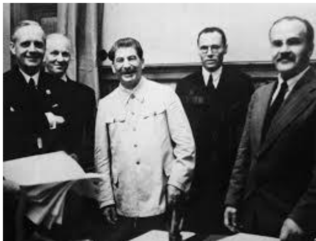
J. von Ribbentrop, J. Stalin and V. Molotov after signing the Nazi-Soviet Non-aggression Pact in Kremlin, Moscow, August 23, 1939

Нагадаем, пра сам Пакт, заключаны 23 жніўня 2015 года, непасрэдня ўдзельнікі якога паказаны ніжэй на здымку.