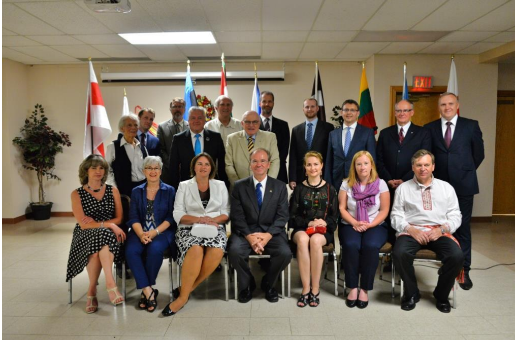
Арганізатары вечара, прадстаўнікі амбасадаў і суполак Атавы

Падчас адзначэння Дня чорнай стужкі сярод на паседжаньнях быў распаўсюджана заява прэм'ер-міністра Канады сп. Харпера (англійскі варыянт зьмешчаны ў канцы артыкула). Ніжэй падаем беларускі пераклад заявы: