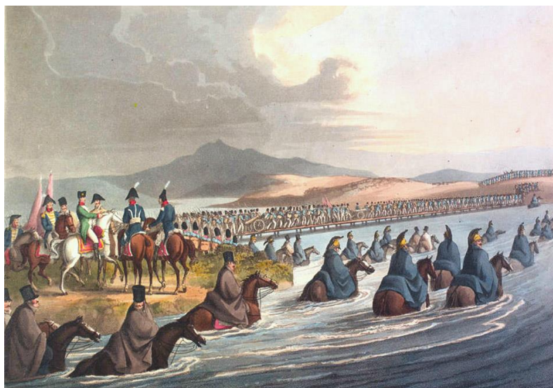
Камп Фридрих Переход через Неман в Россию 1812 год

Как тут не вспомнить роман Л.Н. Толстого «Война и мир», когда уланы польского полка в восторге от случайной встрече с Наполеоном, отказались искать брод, и, чтобы император оценил их усердие, «бросились в быстрину течения», счастливые, что «плывут и тонут под взглядом человека, сидевшего на бревне и даже не смотревшего на то, что они делали».